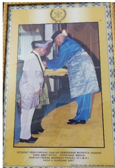
Gambar 3: Istiadat pengurniaan Darjah Kebesaran Mahkota Pahang Yang Amat Mulia

Sebagai insan hebat yang fokus terhadap bidang talaqqī al-Quran bersanad, beliau telah menunjukkan contoh terbaik kepada guru al-Quran yang lain. Beliau juga merupakan tulang belakang penubuhan Lajnah Tashih al-Quran KDN dan Darul Quran JAKIM (Mohamad, Ariffin & Zakaria, 2021). Sebagai tambahan, beliau juga terlibat sebagai Hakim Majlis Tilawah al-Quran Peringkat Kebangsaan, Hakim Majlis Hafazan al-Quran Peringkat Kebangsaan dan Hakim Majlis Tilawah dan Hafazan al-Quran Peringkat Antarabangsa. Hasil sumbangan dan khidmat bakti beliau terhadap negara dan masyarakat telah melayakkan beliau untuk menerima pelbagai anugerah seperti Pingat Darjah Kebesaran Ahli Mahkota Pahang (A.M.P.) pada tahun 1985 dan Darjah Kebesaran Mahkota Pahang Yang Amat Mulia, Peringkat Kedua Darjah Indera Mahkota Pahang (D.I.M.P.) yang membawa gelaran Dato' pada 5 Februari 2007. Beliau sewajarnya dijadikan ikutan dan contoh tauladan para guru al-Quran khususnya di Malaysia.