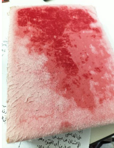
Gambar 6: Buku daftar pelajar Dato' Haji Sallehudin Omar (1)

perlu mencontohi amalan ini supaya dapat menambah kepercayaan masyarakat terhadap pengajian talaqqī al-Quran bersanad.